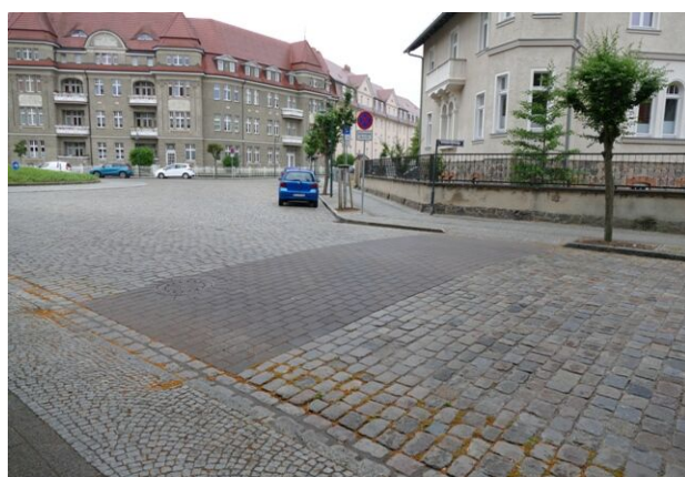
Abgesenkter Bordstein und glatt gepflasterte Querung am Christian-Daniel-Rauch-Platz

Der Innenstadtbereich sei mittels Fördergeldern aus einem Städtebauförderprogramm schon weitestgehend mit neu belegten straßenbegleitenden Gehwegen versehen. Auch seien an vielen Straßenkreuzungen Bordsteinabsenkungen im Sinne der Barrierefreiheit vorgenommen worden. Da die Fahrbahnen mancher Straßen aus Gründen des Denkmalschutzes mit Kopfsteinpflaster ausgestattet sind, seien stellenweise Fahrbahnüberquerungen mit glatten Pflastersteinen geschaffen worden, um Menschen mit Rollator, Kinderwagen und Rollstuhlfahrern den Weg über die Straße zu erleichtern.