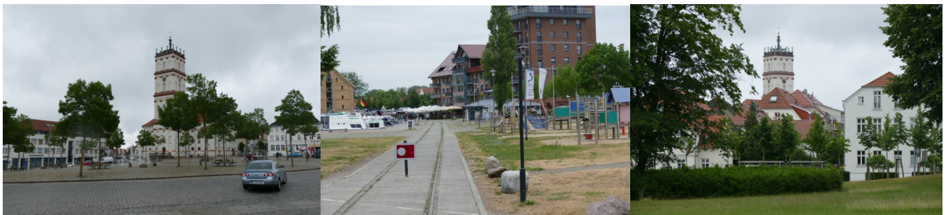
Das touristisch-städtebauliche Dreieck: Marktplatz – Stadthafen – Schlossgarten

Der Marktplatz sei darüber hinaus ein Eckpunkt des touristischen bzw. städtebaulichen Dreiecks der Stadt Neustrelitz, das sich bis zum Stadthafen am Zierker See im Westen und dem Schlossgarten im Süden erstreckt. Alle drei Eckpunkte sind von der Seestraße aus gut erreichbar. Wichtige Wegeverbindungen bestehen vom Marktplatz aus auch über die Augustastraße zum Hauptbahnhof sowie entlang der Fußgängerzone Strelitzer Straße bis zum Einkaufszentrum „Husarenmarkt“.