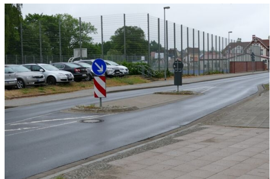
Mittelinsel in der Louisenstraße auf Höhe der Strelitzhalle