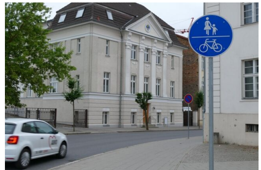
Gemeinsam zu benutzender Fuß- und Radweg in der Friedrich-Wilhelm-Straße

In der Friedrich-Wilhelm-Straßen sollen Absperrketten Fußgänger, die aus Richtung Bahnhof durch die Marienstraße kommen und in Richtung Stadtzentrum wollen, bis zum nächsten Überweg am Kreisverkehr gegenüber des Einkaufszentrums leiten. Der Überweg am Kreisverkehr stellt allerdings aufgrund einer zusätzlichen Rechtsabbiegerspur („freier Rechtsabbieger“) und zweier Mittelinseln auf dem Weg bis zur anderen Straßenseite für Fußgänger eine nicht ganz einfache Situation dar, insbesondere nicht in der Hauptverkehrszeit. Radfahrer, die an dieser Stelle den Gehweg benutzen, werden an dieser Stelle zum Absteigen aufgefordert. Eine Grundstückszufahrt erfordert auf Höhe der Einmündung der Marienstraße in die Friedrich-Wilhelm-Straße jedoch auf der westlichen Straßenseite eine Lücke in der Absperrkette, was von vielen Fußgängern als ungewollte Abkürzung genutzt werde – und augenscheinlich häufig zu Gefahrensituationen führe.