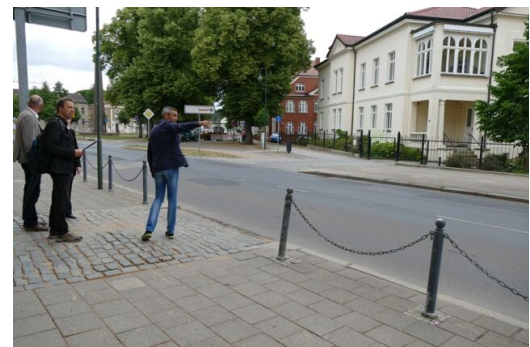
Eine Lücke in der Absperrkette ermöglicht Fußgängern eine willkommene Abkürzung