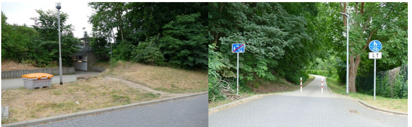
Zuvor: schmal, aber ohne Alternative – der Fußgängertunnel am Hauptbahnhof

Eine wichtige städtische Straßenverbindung ist die Strelitzer Chaussee , welche die Wohngebiete in Kiefernheide und Strelitz-Alt an die Innenstadt und den Hauptbahnhof anbindet. Der Weg aus den südlichen Stadtgebieten zum Bus-/Hauptbahnhof bedingte für Fußgänger eine unattraktive Route entlang der wenig belebten Straße Bahnhof Süd , die als Sackgasse zwischen Gleisanlagen auf einen relativ schmalen Fußgängertunnel zuführt. Ein neu hergestellter Fuß-/Rad-Weg bietet nun eine „luftigere“ alternative Verbindung vom Bus-/Hauptbahnhof (Rudi-Arndt-Platz) zur Strelitzer Chaussee.