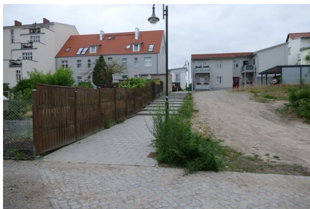
Nicht-barrierefreie Abkürzung: Die Treppenanlage am nördlichen Ende der Twachtmannstraße

Darüber hinaus ist die Stadtverwaltung gewillt, bestehende Lücken im Fußwegenetz durch neue Wege zu ergänzen. So wurde beispielsweise am nördlichen Ende der Twachtmannstraße eine neue Fußwegeverbindung zum Wohngebiet am Töpferberg geschaffen. Aufgrund der topographischen Verhältnisse ist der Weg mit einer Treppenanlage realisiert worden. Nach Fertigstellung gab es öffentliche Kritik wegen der fehlenden Barrierefreiheit. Aus Sicht der Stadtverwaltung stellt der neue Wege dennoch eine Verbesserung dar, da es zuvor an dieser Stelle noch gar kein Wegangebot für Fußgänger gab, diese Wegerelation somit eine neu geschaffene Abkürzung bietet.