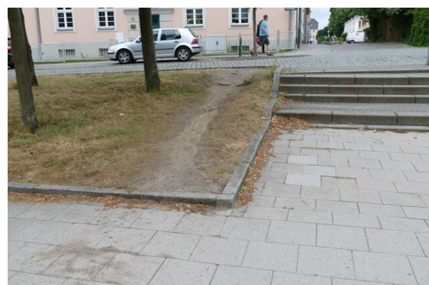
Noch nicht barrierefrei: Der südliche Zugang zum Platz an der Strelitzhalle

An anderen Stellen besteht dagegen noch Nachholbedarf für die Stadt, wie sich bei dem Rundgang herausstellte. Vor Ort erörtert wurde z.B. der südliche Zugang zum Vorplatz der Strelitzhalle. Hier haben sich Radfahrer bereits einen provisorischen Weg „erfahren“. Der ansonsten zu benutzende Zuweg von der Carlstraße aus (südlich der Strelitzhalle) stellt auch insbesondere für geheingeschränkte Menschen von der Innenstadt kommend einen Umweg dar, zumal sie von der südlichen Bürgersteigseite der Carlstraße aus aufgrund straßenbegleitender Stellplätze und fehlender Bordsteinabsenkung an der Stelle schlecht erreichbar ist.