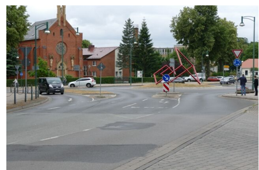
Kein einfacher Überweg für Fußgänger: der Kreisverkehr am Einkaufszentrum