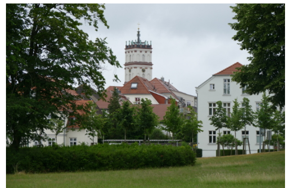
Blick vom Schlossgarten auf die Innenstadt

Kern der Innenstadt ist der quadratische Marktplatz mit seinen achtstrahligen Sternstraßen. Dieser befindet sich zwischen dem Hauptbahnhof im Osten und dem Stadthafen im Westen. Aufgrund einer Ortsumgehung mit den Bundesstraßen B96, B193 und B198 ist der Innenstadtbereich weitestgehend frei von regionalen bzw. überregionalen Durchgangsverkehren. Der Marktplatz mit seiner verkehrlichen Verteilerfunktion weist allerdings einen relativ hohen Kfz-Anteil auf, was die Qualität für den Fußverkehr in gewissem Maße einschränkt. Als wichtigste Geschäftsstraße und zugleich Fußgängerzone schließen sich die Strelitzer Straße und ein Einkaufszentrum im Südosten daran an.