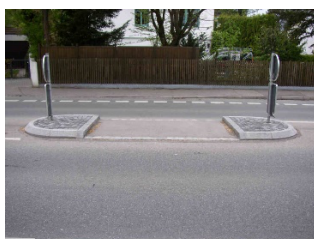
Mittelinsel Insel in der Straßenmitte; Zum Verschnaufen in der Fahrbahnmitte;