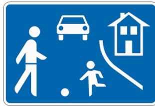
Beruhigte Verkehrszone „Spielstraße“