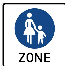
Fußgängerzone Autos und Fahrräder sind hier nicht erlaubt

Welche Verkehrszeichen oder Begriffe sind dir wichtig? Kreise sie ein.