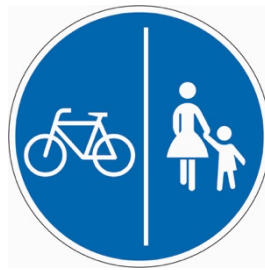
Getrennter Weg von Fußgänger:innen und Radfahrer:innen