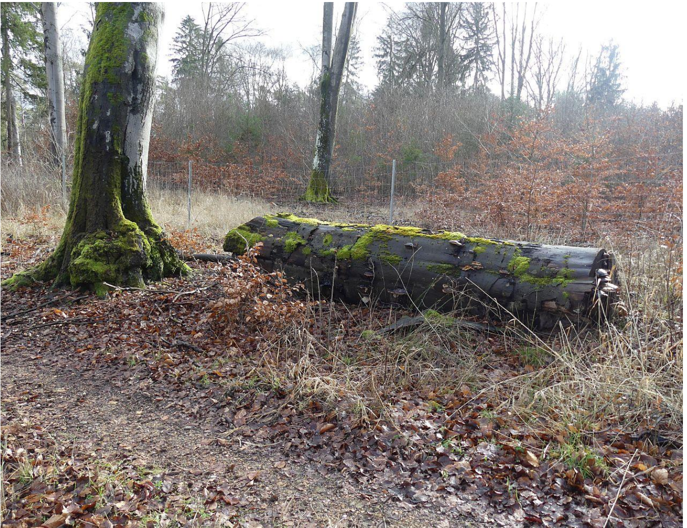
E10 auf dem Weg in Richtung Blumenower Straße (19)

Im Einzelnen werden folgende Maßnahmen empfohlen, an denen sich Mitglieder der beiden Vereine nach ihren Möglichkeiten auch beteiligen würden.