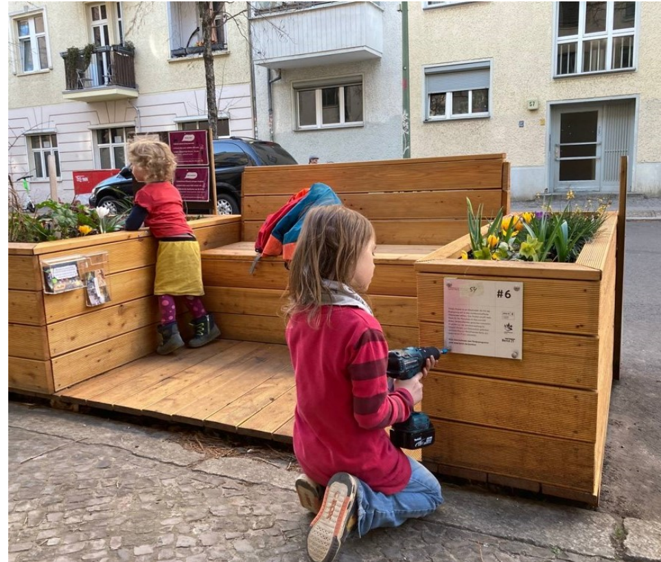
und nachher