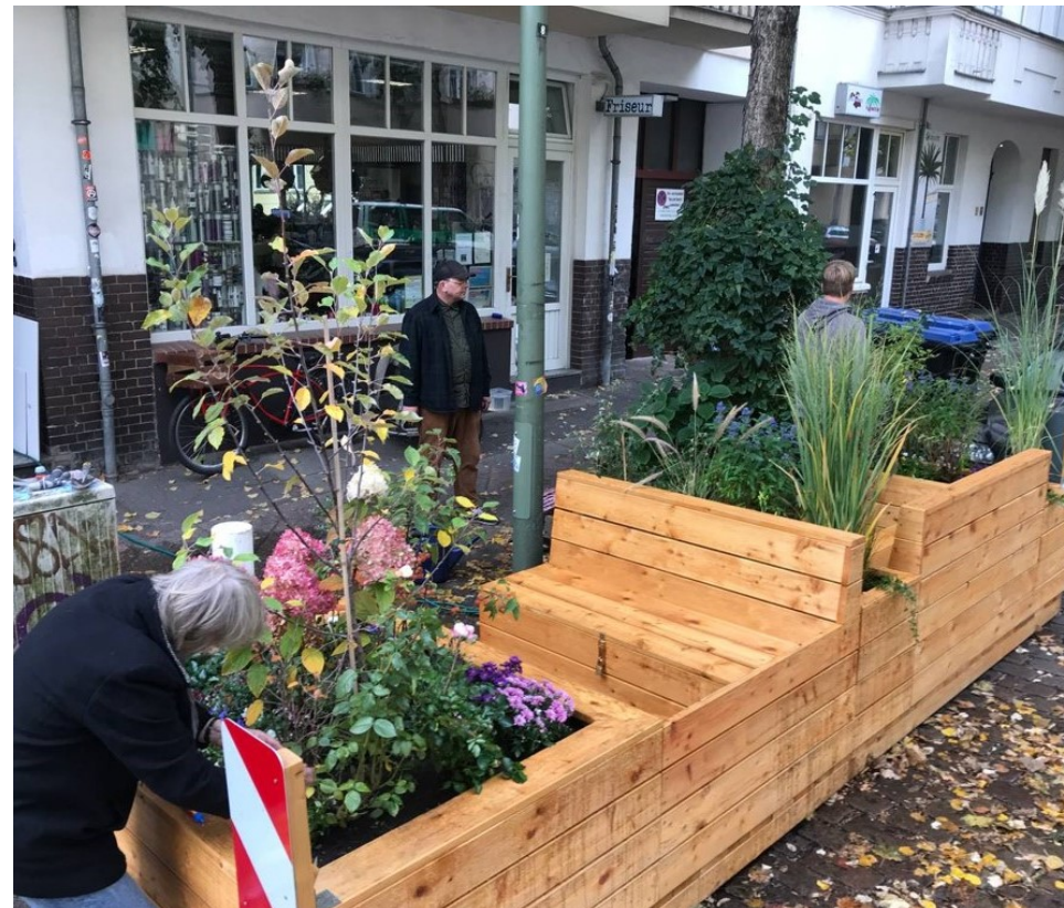
und nachher