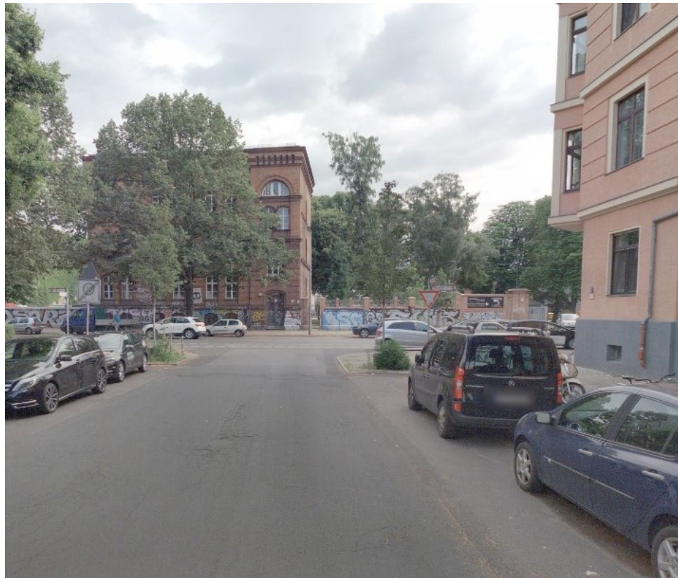
Pücklerstr. 51 vorher