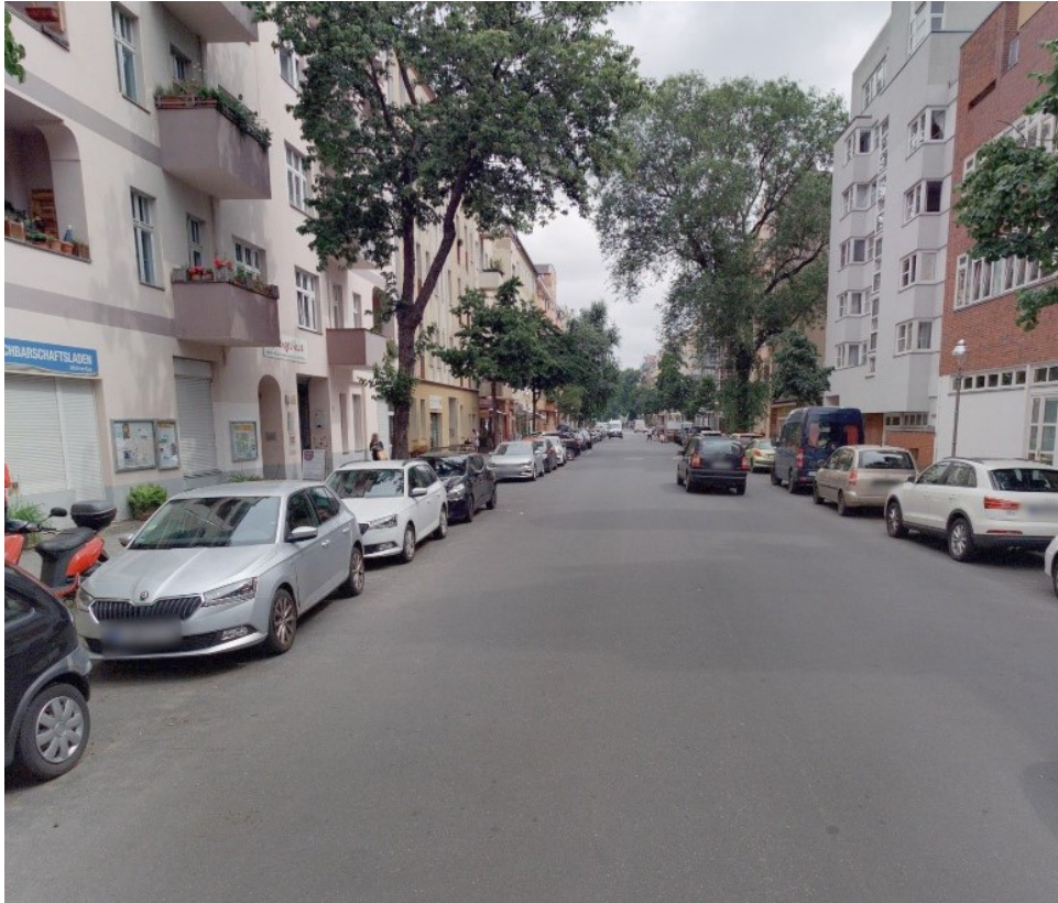
Sprengelstr. 15 vorher