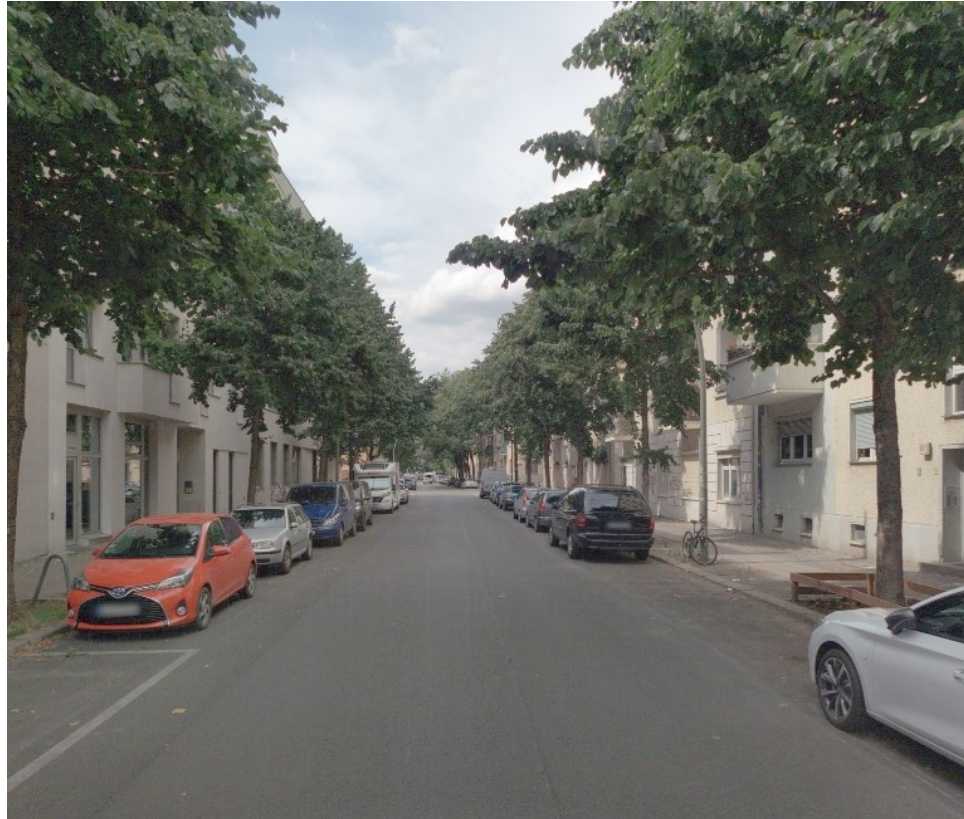
Simplonstr. 54 vorher