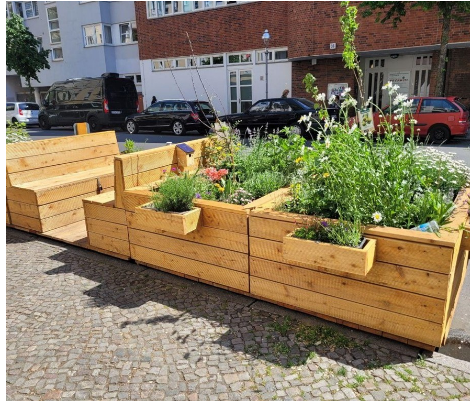
und nachher