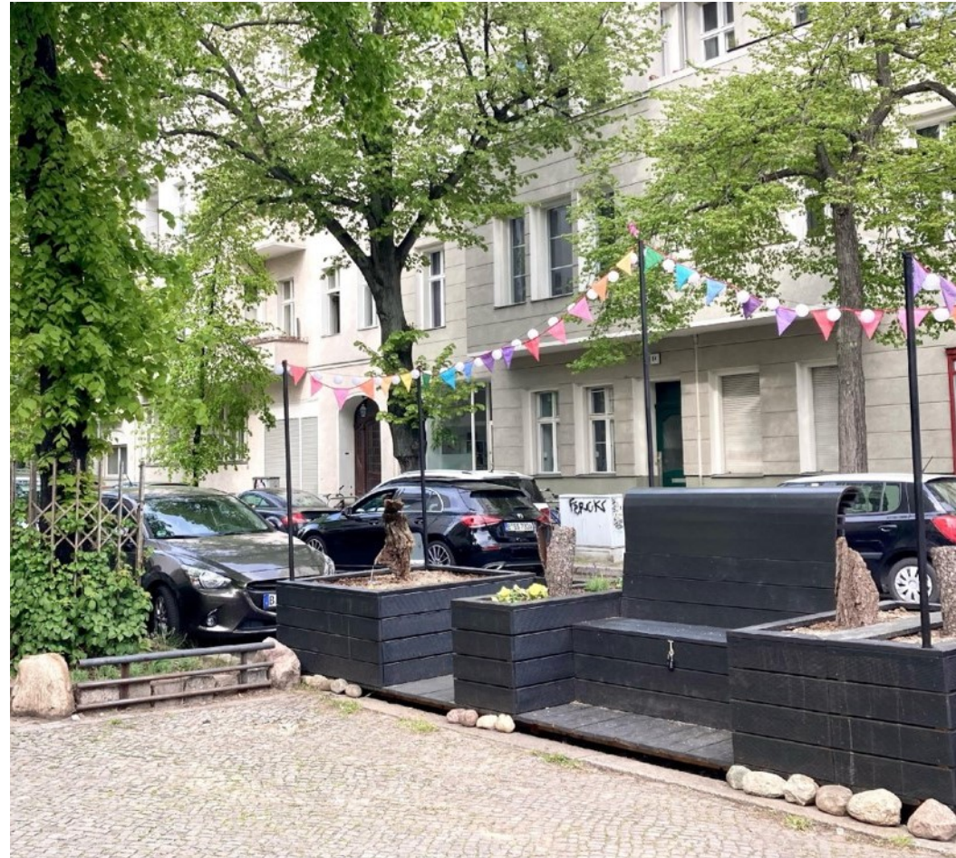
Parklet in der Fritschestraße