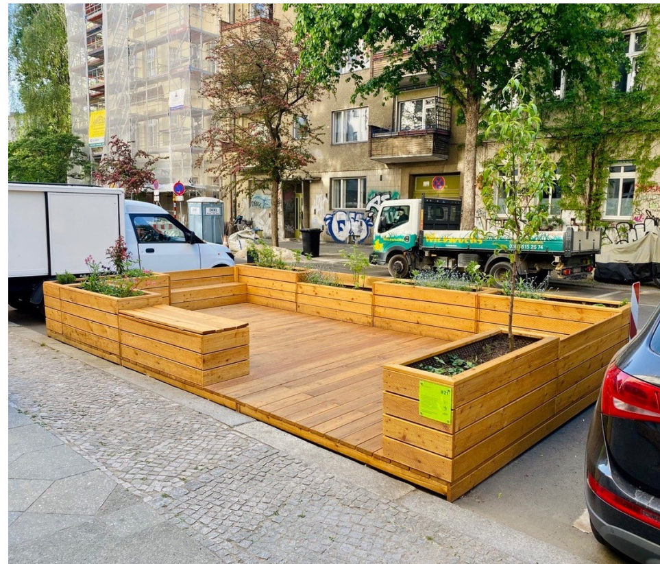
und nachher