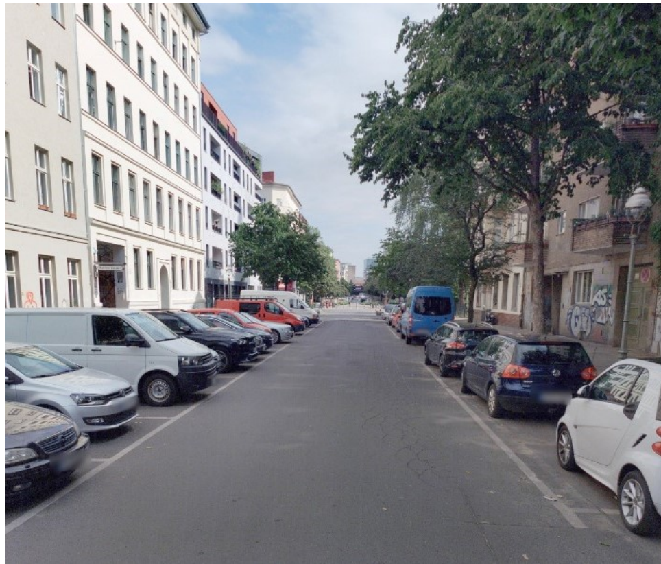
Cuvrystr. 21 vorher