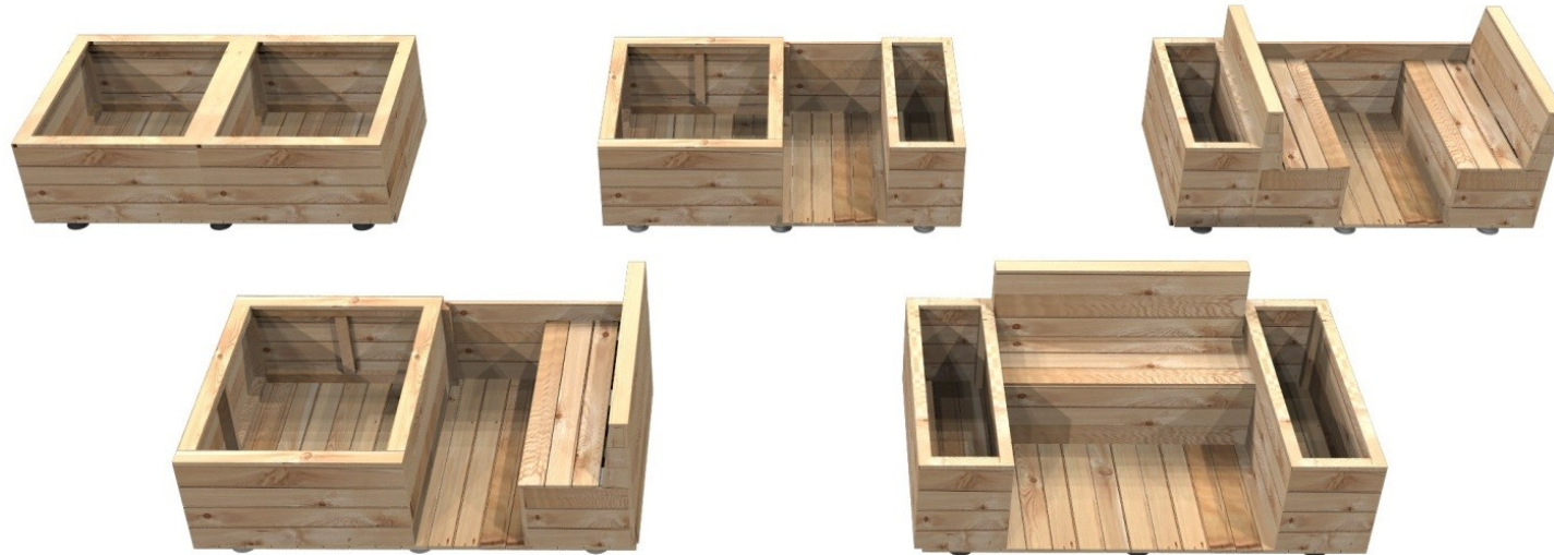
Zur Verfügung stehende Parkletmodule