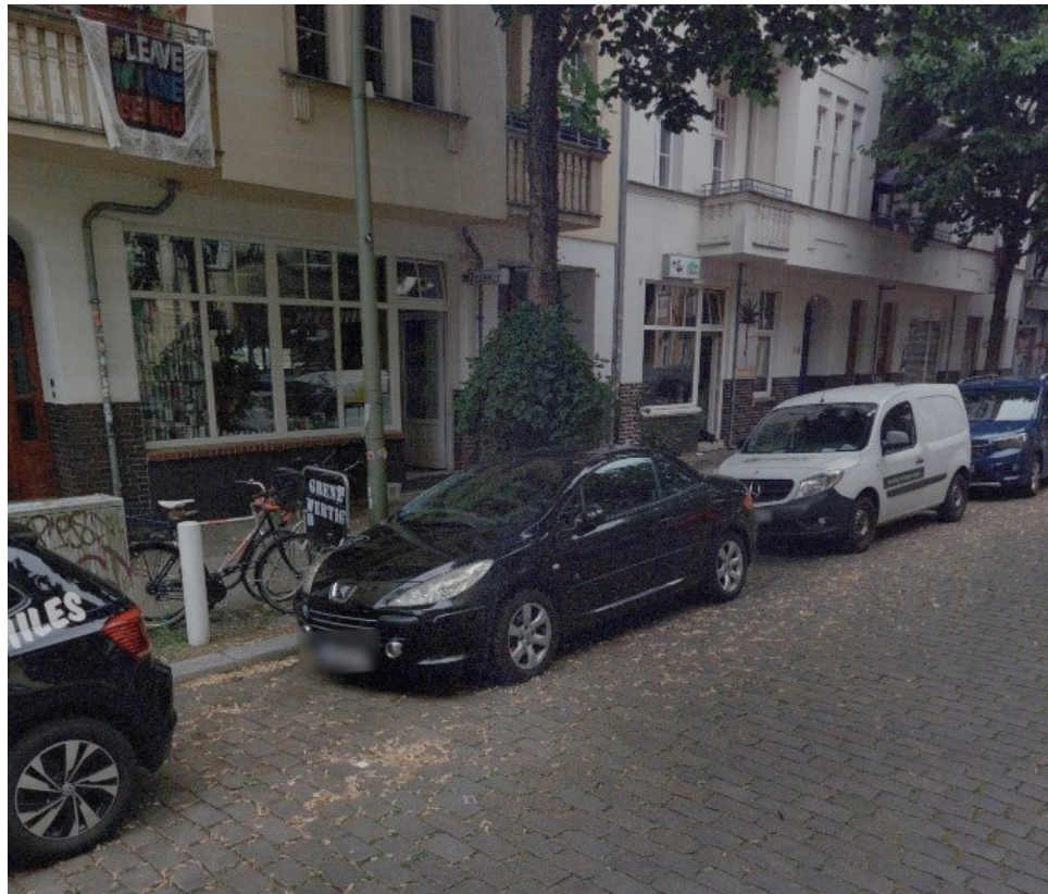
Simplonstr. 16 vorher