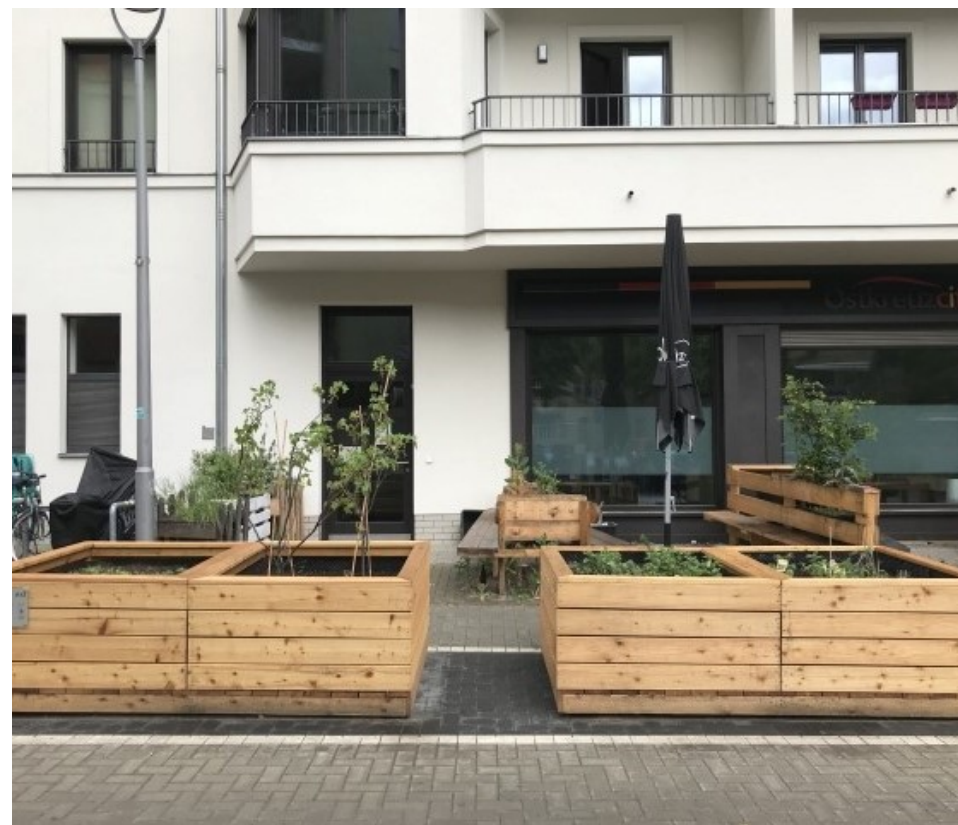
und nachher