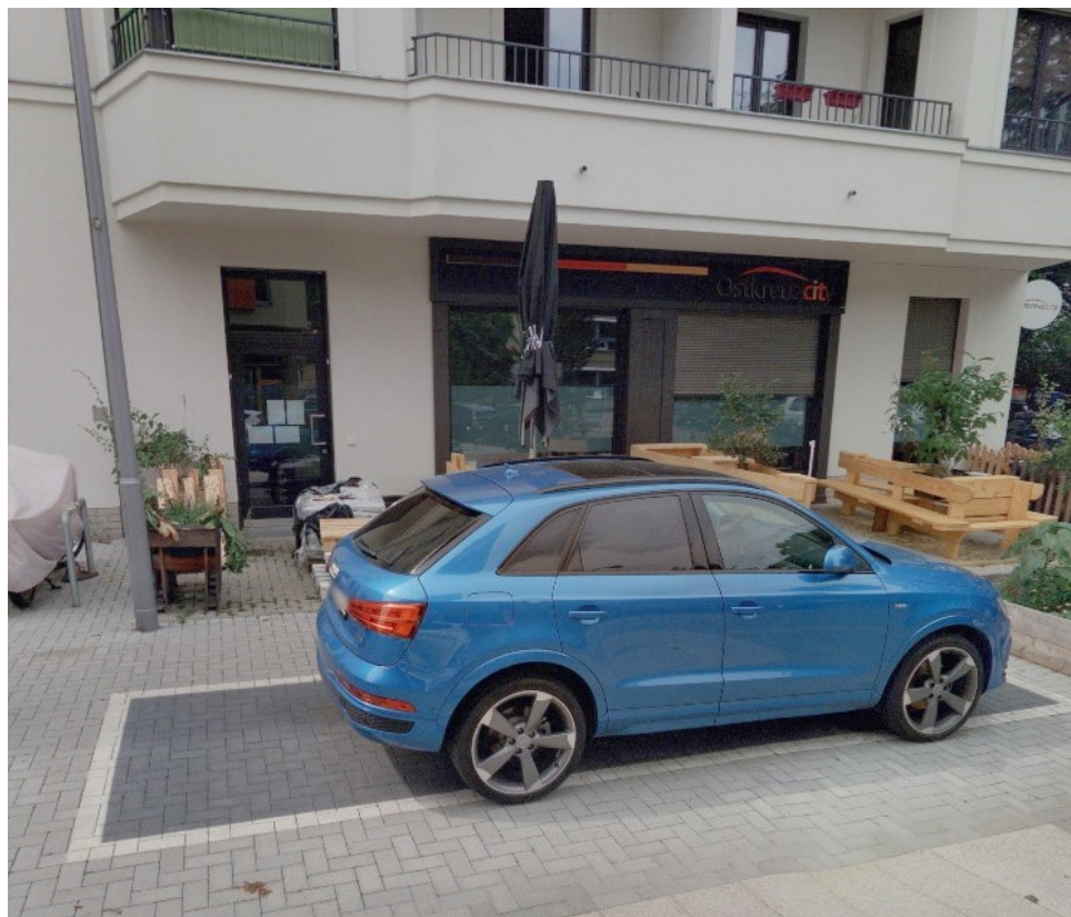
Simplonstr. 38 vorher