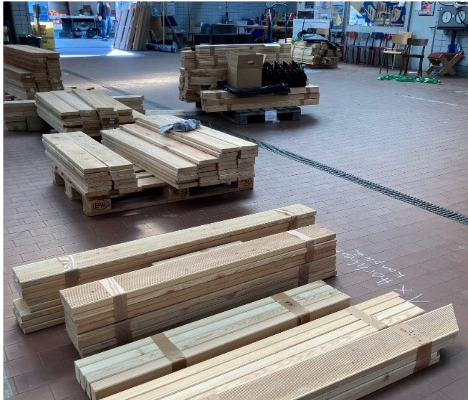
Bauworkshop zum Parkletbau